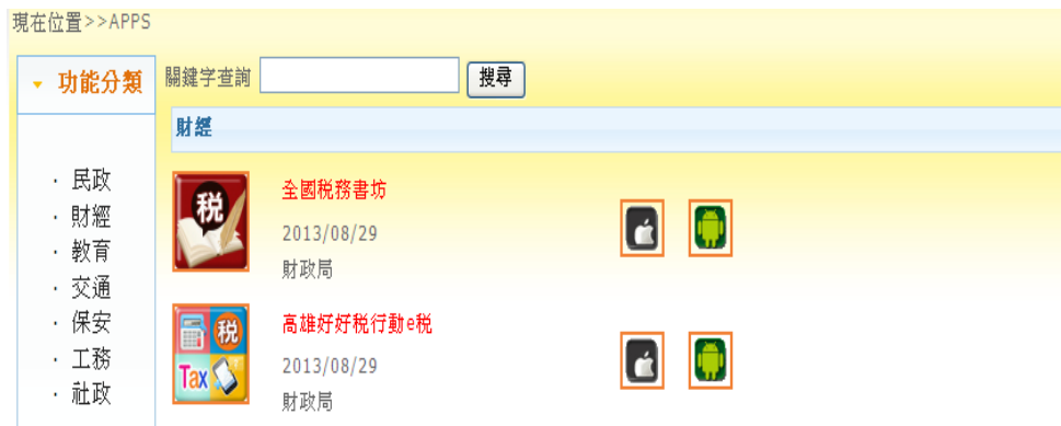
圖6 財經類 APPs