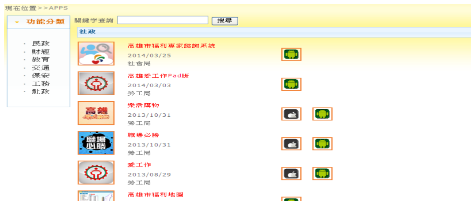
圖11 社政類 APPs