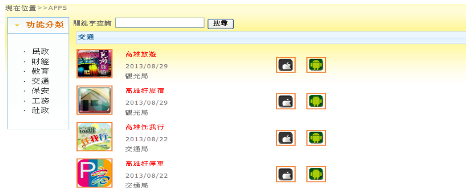
圖8 交通類 APPs