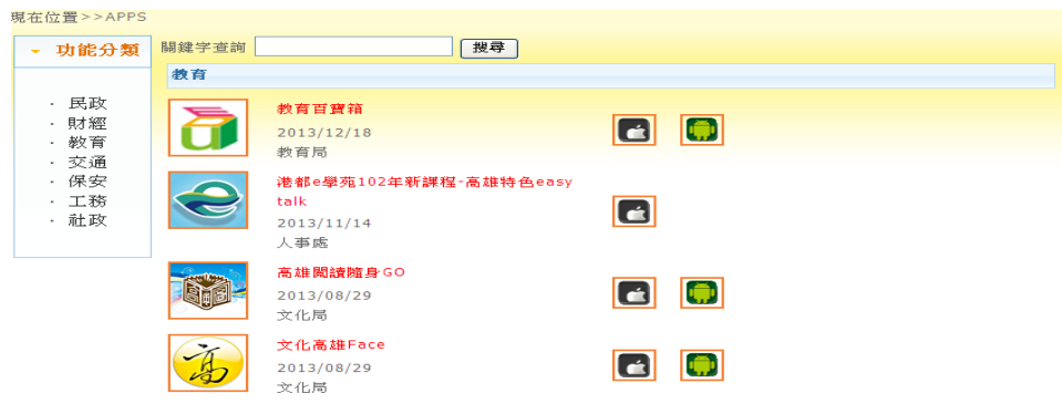
圖7 教育類 APPs