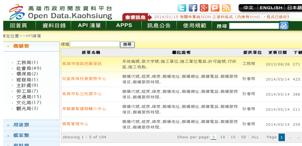
圖4 API 清單