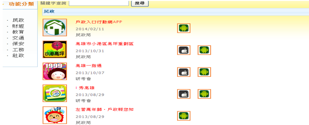
圖5 民政類 APPs