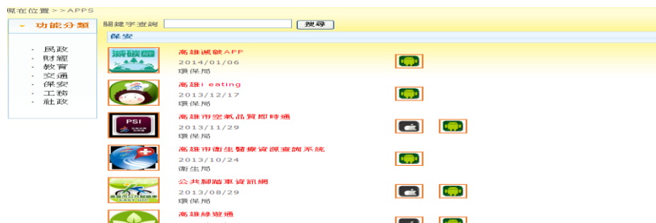
圖9 保安類 APPs