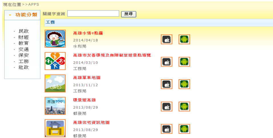
圖10 工務類 APPs