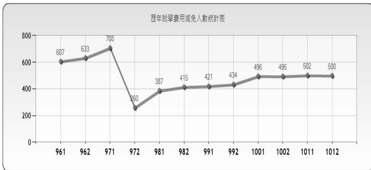
高雄市立空中大學各類學生就學費用減免金額暨人數統計表